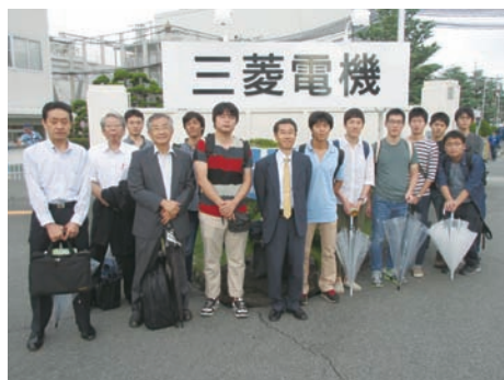
三菱電機 伊丹製作所

スマートグリッド実証設備では、将来の送配電網を想定し、構内に敷設された実証用配電線・通信ネットワークや太陽光発電設備、スマートメーター、系統電源模擬発電装置などの設備を構内に構築し、再生可能エネルギー大量導入時の課題抽出や対策技術に関する検証を行っており、この研究開発の状況についてご説明いただくとともに、これらのスマートグリッド実証設備を見学しました。開閉機器関係では、ガス絶縁遮断器の構造や開閉機器の研究開発状況などについてご説明いただくとともに、開閉機器の製造ラインや研究設備、およびこれら開閉機器の試験を行う高電圧・大電流試験設備を見学させていただきました。