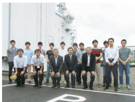
関西電力 神崎変電所

火力発電所の廃止に伴う電圧安定性維持のために導入されたSVGについて、その動作原理や特徴および変圧器タップとの協調制御などについてご説明いただくとともに、SVG装置の変換器主回路、制御保護装置、冷却システムなど、実際の設備を見学させていただきました。