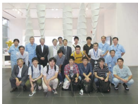
住友電気 大阪事業所

超電導ケーブルについては、ビスマス系超電導線材の研究開発状況をご説明いただくとともに、実際の超電導線材や超電導電力用ケーブル、構内に布設されたケーブル実証設備や液体窒素を用いた冷却システムなどを見学しました。レドックスフロー電池については、電池の原理・特徴および風力発電・太陽光発電の変動平滑化などに対する検証試験の状況や用途など、研究開発の最新状況をご説明いただくとともに、実際に稼働している電池試験設備を見学しました。電力ケーブル工場では、CVケーブルやOFケーブルの製造ラインを見学させていただき、実際に電力ケーブルが製造されていく一連の工程についてご説明いただきました。