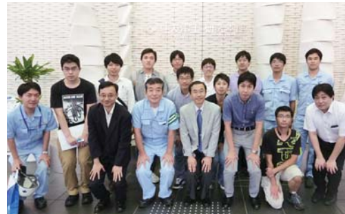
住友電気工業 大阪製作所

超電導ケーブルについては、ピスマス系超電導線材の研究開発状況をご説明いただくとともに、実際の超電導線材や超電導電力用ケーブル、構内に布設されたケーブル実証設備や液体窒素を用いた冷却システムなどを見学させていただきました。レッドクスフロー電池については、電池の原理・特徴および風力発電・太陽光発電の変動平滑化などに対する検証試験の状況や用途など、研究開発の最新状況をご説明いただくとともに、実際に稼働している電池試験設備を見学させていただきました。電力ケーブル工場では、OF・CVケーブルの構造・特徴についてご説明いただくとともに、CVケーブルの製造ラインを見学させていただき、実際に電力ケーブルが製造されていく一連の工程についてご紹介いただきました。