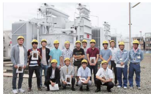
関西電力 神崎変電所

変電所本館では、変電所の制御室を見学させていただき、常時は遠隔操作で無人である説明を伺いました。そのため、変電所入口付近に赤外線による侵入者感知器およびITVカメラが設置されており、その設備も見学させていただきました。火力発電所の廃止に伴う電圧安定性維持のために導入されたSVGについて、その動作原理や特徴および変圧器タップとの協調制御などご説明いただくとともに、SVG装置の変換器主回路、制御保護装置、冷却システムなど、実際の設備を見学させていただきました。