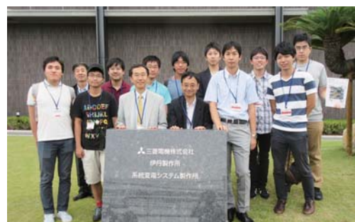
三菱電機 伊丹製作所

系統変電システム製作所のショールームには、実物大のガス絶縁遮断器や開閉機器 (GIS) 設備等が展示されており、間近で開閉機器を見学することができ、機器の構造や仕組みの理解を深めることができました。また、現在海外向けGIS設備を製造している工場を見学させていただき、開閉機器の試験を行う高電圧・大電流試験設備についてもご説明いただきました。先端技術総合研究所では、開閉機器の研究開発および次世代HVDC送電用SiC変換器の研究開発の最新状況についてご説明いただきました。